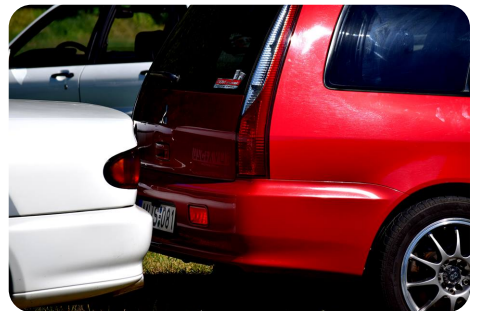
Autómozaik építés: Vigyáztunk egymás autóira