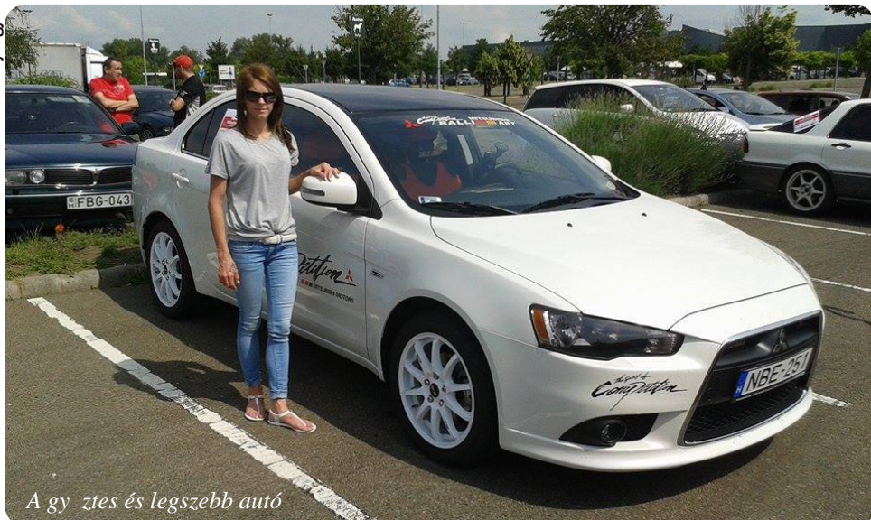
A gy ztes és legszébb autó