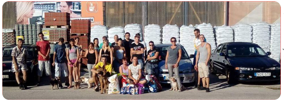
A siófoki állatmenhely támogatói

Mindenkinek hatalmas gratuláció és elismerés, ugyanis a klubtagok néhány nap