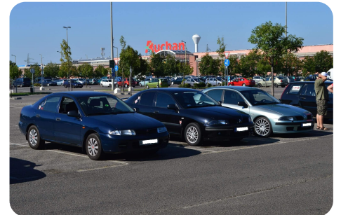
Idén a Carismák voltak kevesebben