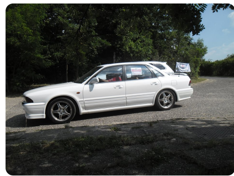
Sigma lett a legszebb Mitsubishi

A feladat helyszíne eredetileg Visegrádon, a Salamon torony parkolójában lett volna. De még a versenyzők megérkezése előtt egyik pillanatról a másikra egy delegáció fekete színű autói lepték el a helyszínt. A