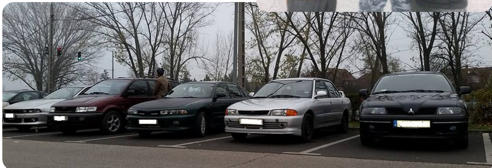
Teljes béke a típusok között...