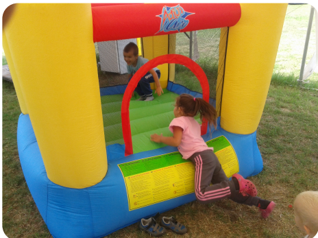
A gyerekek kedvence volt az ugrálóvár

A Parti sátorban gyereksarkot alakítottunk ki.