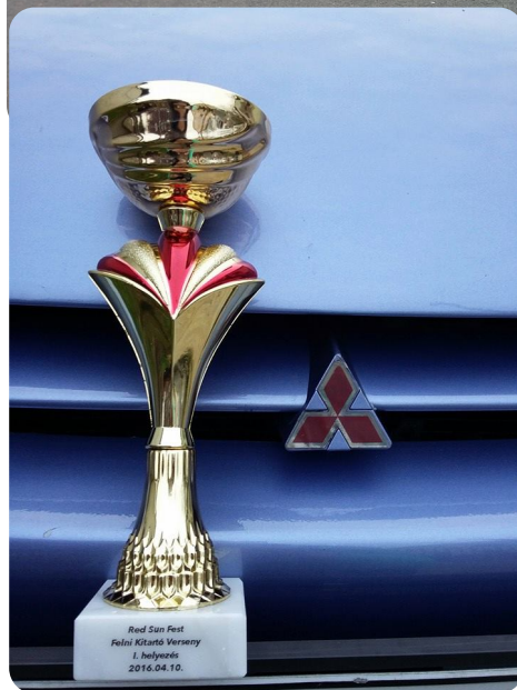
N i felnikitartás 1. hely