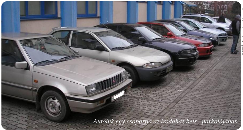
Autóink egy csoportja az irodaház, belső parkolójában