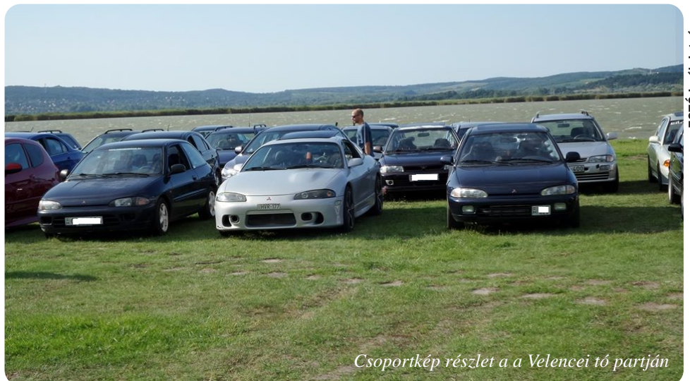
Csoportkép részlet a a Velencei tó partján