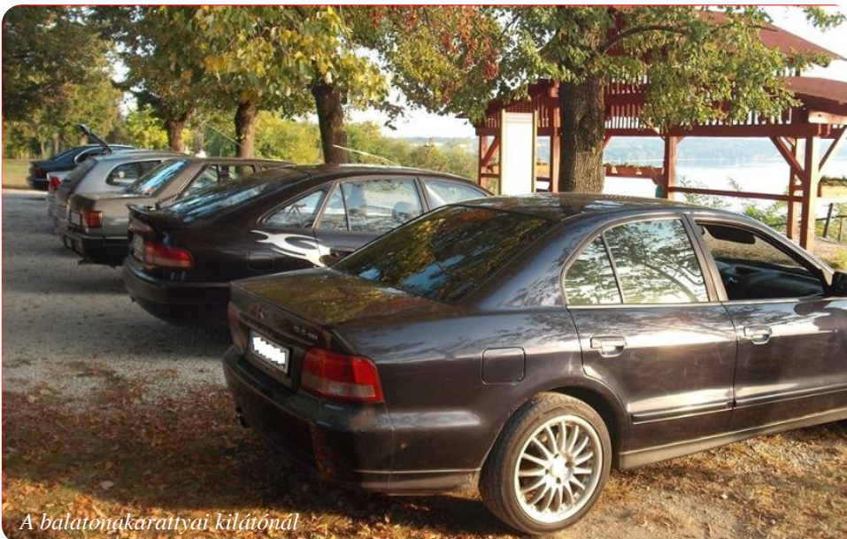
A balatonakaratyáni kilátónál