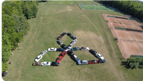
26 db Mitsubishi b l álló autómozaik

Korán keltünk, mivel 8 órára készen kellett lennünk a helyszín további építésével. Ezt sikerült teljesítenünk is, és legnagyobb örömünkre folyamatosan érkeztek a találkozó résztvevői. Délelőtt négy feladatból álló mini Gyémánttúrát szerveztünk. Felni kitartás, folyadék felismerés, "részeg so-