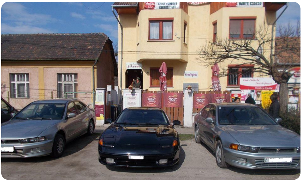
A Vendégház előtt a csók fogságában...

A vidékiek és az italozó pestiek helyben, kulturált körülmények között tudták az éjszakát eltölteni. Az évszakhoz képesti esős, hűvös időjárás nem tudta a jókedvünket elvenni. Szponzorainknak köszönhetően senki nem halt éhen és szomjan. A kötetlen beszélgetések, sztorizások leginkább autóink és a mindennapi élményeink felelevenítése körül zajlott. A buli hajnali egykor ért véget. Nagyon jól éreztük magunkat. Dicséret az ötletgazdáknak, szervezőknek, szakácsoknak és a résztvevőknek! SZÖVEG Gabo