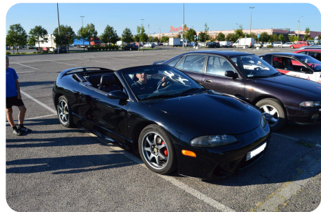
Nem Carisma, de ...