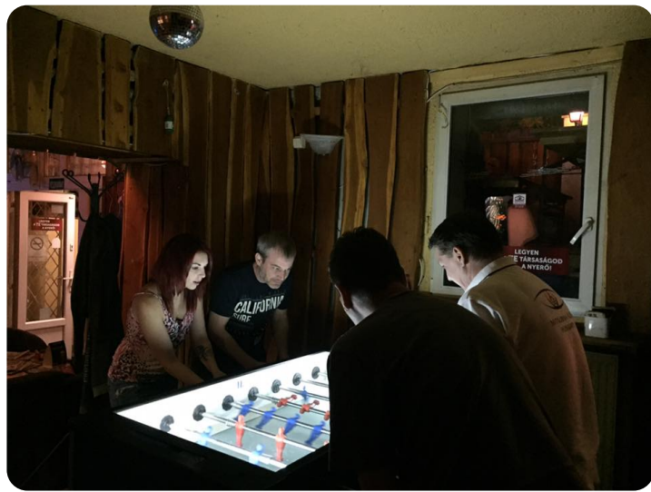
Vérremen küzdelem a csocsóasztalnál