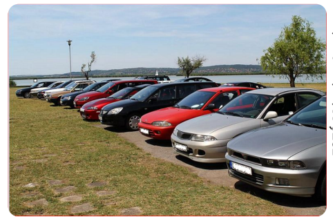
Szépén sorakoztak az autóink

Talán éjfél előtt egy órával végre megérkezett németországi vendégünk is. Előre nem várt műszaki hiba miatt (nem Mitsubishihivel hanem egy amerikai furgonnal indult el Drezdából) kicsit hosszúra sikeredett az útja. De még időbe megérkezett, megmentve ezzel a távolmaradott külföldiek becsületét.