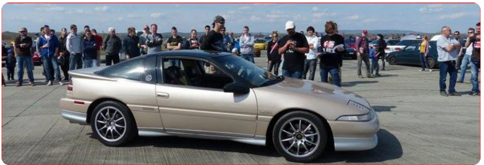
Carstyling szépségverseny: Engine&Exhaust kategória - Eclipse GST - 1. hely - Blindmouse