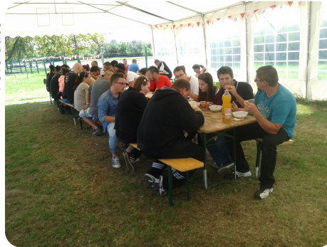
Több turnusban étkeztünk