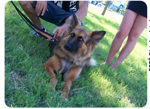
Egyik klubtagé már a siófoki állatmenhely volt lakója

A találkozókra megjelenők a környező településekről és városokból, bár elvéve,