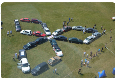
Az elkészült logó a helikopterről fényképezve.

Reggel kilenc óra körül gyülekeztünk többen is a Fót és Dunakeszi határán lévő Tesco parkolóban. Innen menetoszlopban