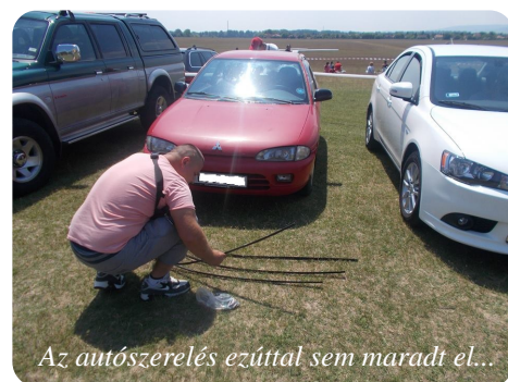
Az autószerelés ezúttal sem maradt el...