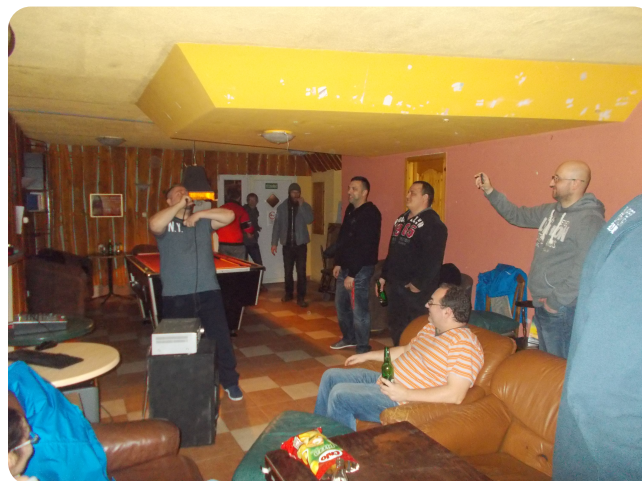
Jól szórakoztunk a kareoke-n

A programon készült felvételek megtekinthetőek (csak kiváltságosoknak) a facebook-on a Mitsubishi Hangoverben... SZÖVEG Gabo