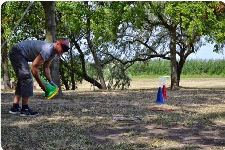
Munkában a "részeg sof r"

főr" és célbadobás szerepelt a programban. Fiúk, lányok és gyerekek szívesen vettek részt rajta.