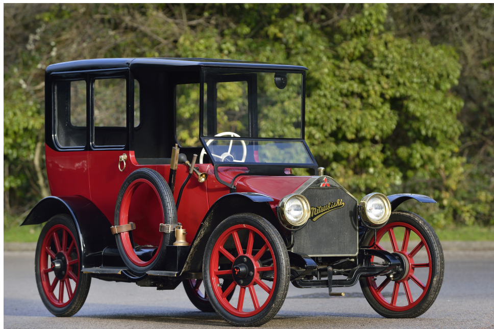
Mitsubishi Model A - 1917

"Ez egy forradalmi autó. Maximális teljesítményt és kényelmet nyújt. Könnyen kormányozható. Óriási a sebessége, veszélytelen és biztonságos a fékezés. Az