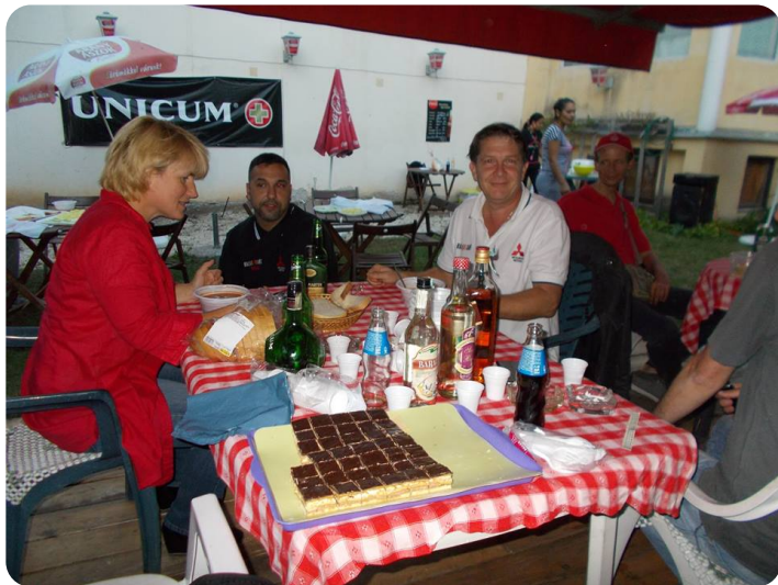
Páran az asztal körül és az a bizonyos sütemény

Ezúttal is minden a megszokott menetrend szerint zajlott. A pincérek az érkezőket itallal fogadták. A bográcsban gulyás főtt, a grillrácson hús sült. Amint elkészült a vacsora asztalhoz ültünk, és neki is láttunk a jobbnál jobb falatoknak.