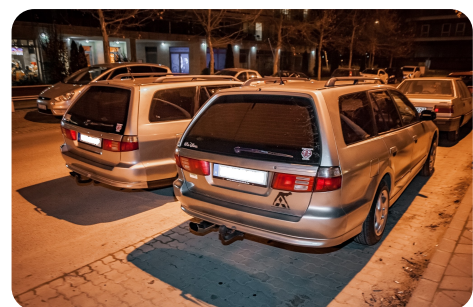
... és mentek.