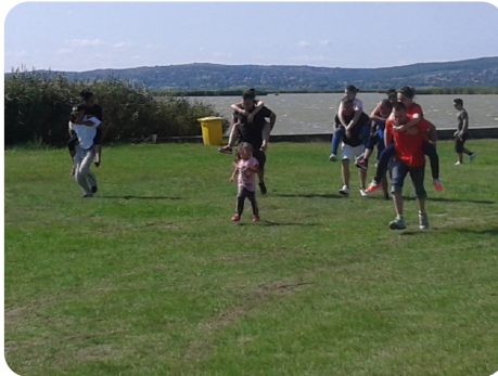
Feleség/barátnő cipel verseny