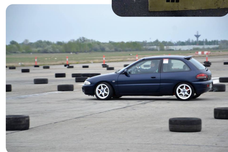
Horváth Dávid - Colt 2.0 turbo