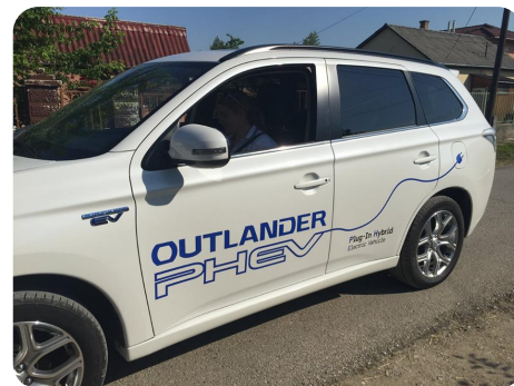
FOTÓ Benkő József