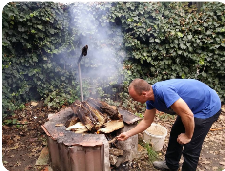
Készül a vacsoránk itt is...