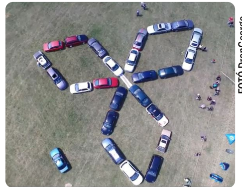
Az elkészült logó a drónról fényképezve.

Az élő Mitsubishi logó végül 24 db autóból állt össze. Minden résztvevőt oklevélben részesítettünk. Ezúton szeret-