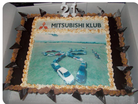
A messzir l érkezett tortánk