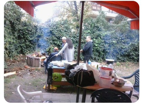
... ott is.