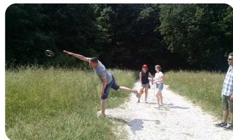
Az egyik tanítható mozdulat

Ezt követően egy féktárcsát kellett minél messzebbre hajítani. Ezt többen, többféle