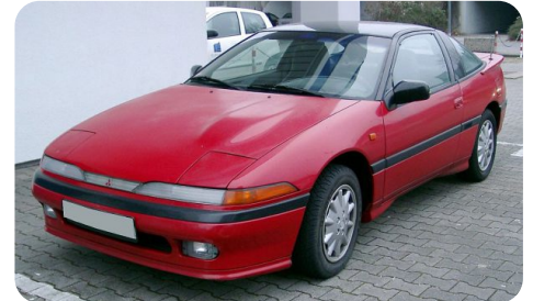
A 2.0 GTi Eclipse annyiba került, mint a Galant HB 2.0 GTi 4WD+4WS

Colt 1.3 EL 3-ajtós (67 LE) 97,200,- Lancer 1.8 GL dízel 4-ajtós 129,900,- Lancer 1.8 4WD kombi (90 LE) 133,300,- Galant 1.8 GLS TD (75 LE) 160,600,- Galant 2.0 GTi (144 LE) 221,000,- Pajero TD EXE 3-ajtós (84 LE) 227,200,- L300 4WD TD (84 LE) 220,000,- Space Wagon 2.0 EXE (84 LE) 157,800,- Starion 2.6 T (155 LE) 266,700,-