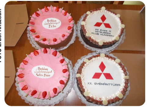
A születésnap torták