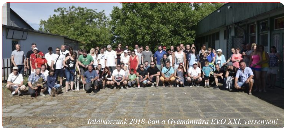
Találkozunk 2018-ban a Gyémánttúra EVO XXI. versenyen!