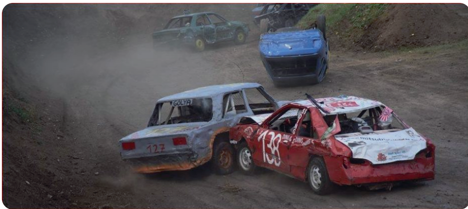
Van itt minden, mint a búcsúban. Ütközés és borítás egyaránt (2017, Hatvan)