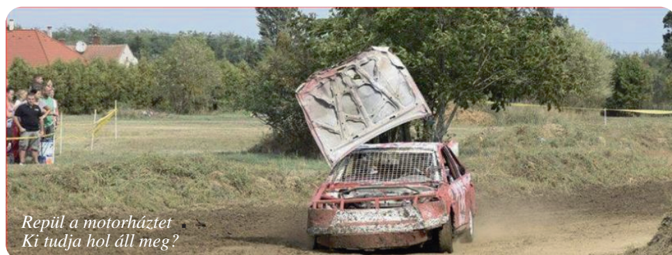
Repül a motorházatet. Ki tudja hol áll meg?

- Köszönöm a beszélgetést. Sok sikert kívánok a következő versenyeidhez!