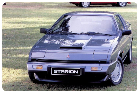
A Starion közel 3 Colt árába került

1987-ben igen széles típusválasztékkal indult az értékesítés. Colt, Lancer, Galant, Pajero, L300, Space Wagon és Starion közül lehetett választani a pénztárca vastagságától függően. De mibe került akkor egy Mitsubishi? Néhány példa ezek közül