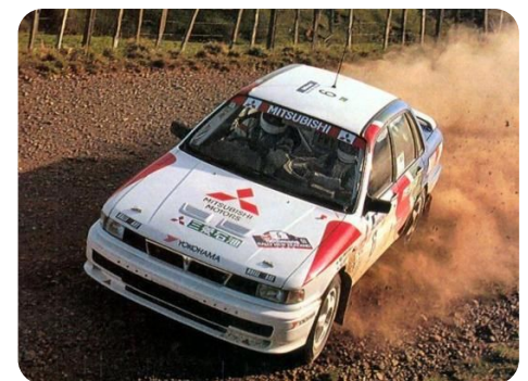
Galant már a versenypályán