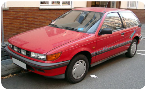
A legolcsóbb Mitsubishi volt itthon

1987 Létrejött a Contrex Kereskedelmi és Fejlesztési Kft., amely az osztrák Denzel AG-val közösen megkezdte a Mitsubishi gépjárművek értékesítését Magyarországon. Egyelőre csak valutáért, és a gépkocsikat Bécsben kellett átvenni. Az első esztendőben 180 db Mitsubishi talált így gazdára.